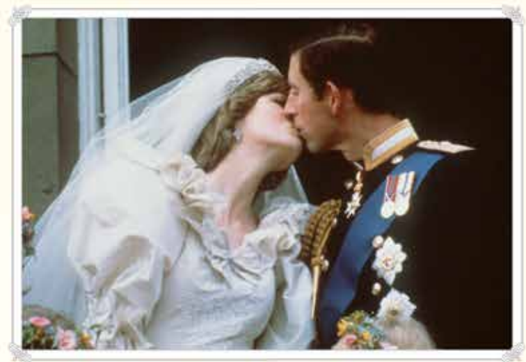
Károly herceg a Buckingham-palota erkélyén megcsókolja a menyasszonyát a tömeg éljenzése közepette

Aztán 1981-ben Károly feleségül vette Lady Diana Spencert. Az esküvőt a televízió úgy mutatta be, mint egy tündérmesét.